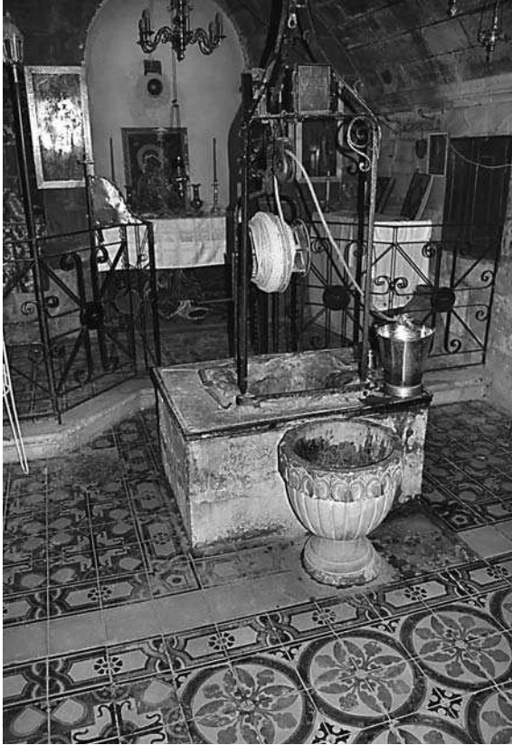
4. Studnia Jakuba

W tym samym okresie powstała również diaspora samarytańska, która pojawiała się zazwyczaj tam, gdzie istniała diaspora żydowska. Były więc one rozrzucone na obszarze prawie całego basenu Morza Śródziemnego, głównie w Egipcie, w okolicach Tyru, w Zajordanii, na wybrzeżu palestyńskim, w Grecji, Syrii, Babilonii i na wyspach (Delos, Tasos, Rodos, Sycylia), w Italii i w Azji Mniejszej. W wielu z tych miejsc Samarytanie zakładali własne synagogi. Podobnie jak Żydzi służyli w wojsku jako najemnicy, zajmowali się handlem lub byli po prostu osadnikami sprowadzonymi w różne miejsca ówczesnych imperiów w celu zaludniania ziemi. Część z nich służyła jako niewolnicy, inni zdecydowali się na życie w diasporze ze względów ekonomicznych 8 .