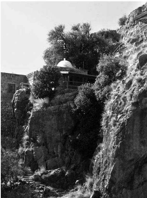
1. Druzyskie miejsce kultu w Cezarei Filipowej

Ci pierwsi zamieszkują Liban, Syrię i Jordanię, a w mniejszej liczbie można znaleźć ich również w Izraelu, Autonomii Palestyńskiej i strefie okupowanej. Ich populację oblicza się na ok. pół miliona osób (fot. 1). Początki Druzów sięgają XI wieku po Chr. Są oni wyznawcami religii stanowiącej formę synkretyzmu islamu szyickiego, judaizmu, chrześcijaństwa i gnozy. Studiują swoje święte