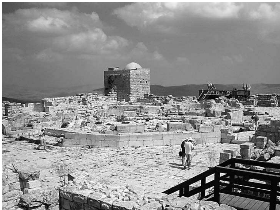
3. Ruiny budowli świątynnych na górze Gerizim

Ich biblijna nazwa: Šōmʿrōnīm (w LXX i Nowym Testamencie: Samaritai ) (2 Krl 17, 29), nawiązuje do Samarii ( Šōmʿrōn ) – miejsca, w którym się osiedlili. Sami jednak nazywają siebie Šōmʿrīm – od czasownika „ šamar ” („strzec”, „zachowywać”), uważając, że jedynie oni zachowują prawdziwą Torę 4 .