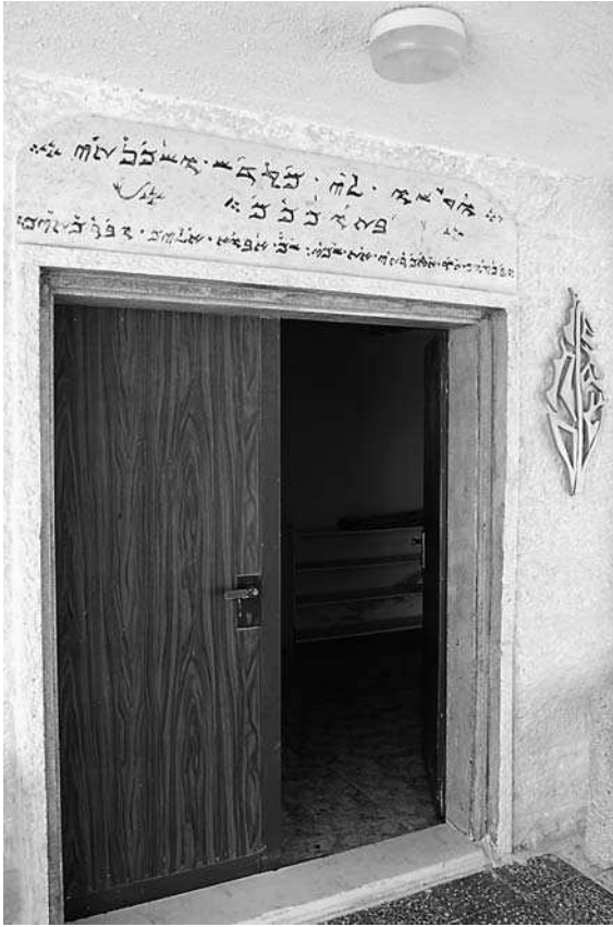
5. Wejście do synagogi samarytańskiej w Kiryat Luza (fot. M. Zieliński)

Oczywiście Samarytanie przez cały czas zamieszkiwali również okolice góry Gerizim (fot. 2). Ich świątynia została definitywnie zniszczona w 484 r. przez Rzymian, którzy w ten sposób pragnęli położyć kres antychrześcijańskim wystąpieniom Samarytan (fot. 3). Interwencja ta okazała się jednak nieskuteczna i dopiero w 529 r. cesarz Justynian (483–565) pozabawił ich autonomii. Od tego momentu ich znaczenie i liczba nieustannie malały.