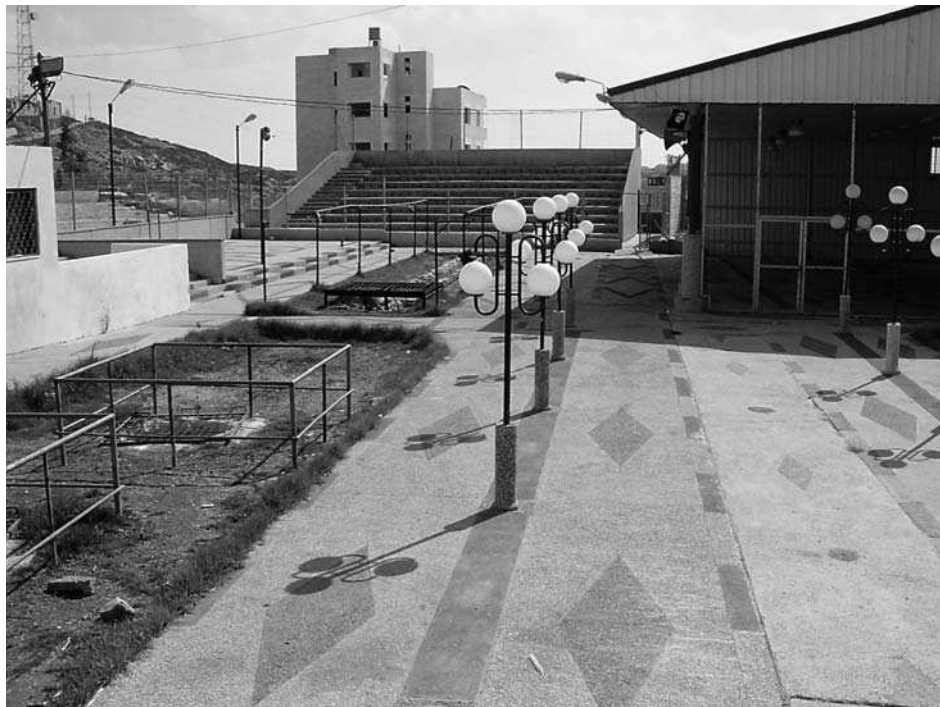
8. Miejsce celebracji paschy przy synagodze samarytańskiej w Kiryat Luza

Samarytanie posługując się własnym, różnym od żydowskiego kalendarzem, obchodzą tylko święta wzmiankowane w Torze (Wj 23, 14-17; 34, 18-23; Pwt 16, 1-17; Kpł 23, 1-44). Jest ich siedem: (1) Pascha (fot. 8), (2) Przaśniki, (3) Święto Tygodni, (4) Nowy Rok, (5) Dzień Przeblągania, (6) Święto Namiotów, (7) Radości Tory. Nowy Rok w samarytańskim kalendarzu przypada 14 dni przed Paschą, a więc pierwszym miesiącem roku jest Nazin. Paschę rozpoczynają Samarytanie od zabijania baranków i kozłów na górze Gerizim 21 .