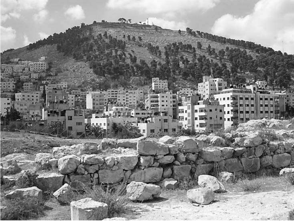
2. Góra Gerizim

księgi, wśród których znajduje się również Nowy Testament i Koran. Wielu młodych Druzów służy jako najemni żołnierze w armii izraelskiej. Po zakończeniu służby zajmują się rolnictwem 1 .